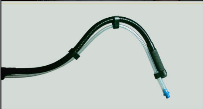
Mundstück mit Rückflussventil

Durch den Kraft'schen Trinkständer wird den Benutzern ein Stück Selbstbestimmung zurückgegeben und die Pflege erleichtert.